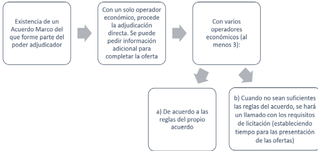
Figura No. 8 Procedimiento de adjudicación Acuerdo Marco -Directiva 2004/18/CE